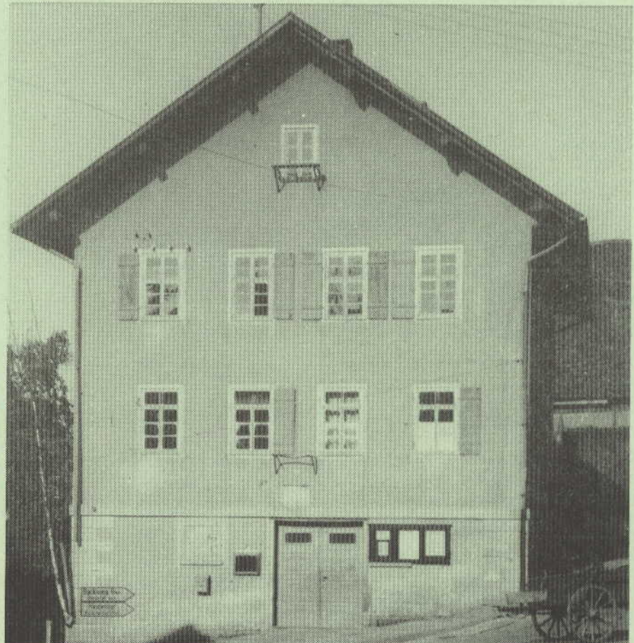
Altes Schul- und Rathaus in Weiler zum Stein

8 D' Staffel ra mit zwoi drei Höpfer Staoßt zu ons dr Christian Klöpfer, Hentrem jonge Ehema Trippelt fraoh sei Ehgespa.