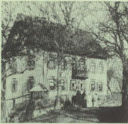
Haus vom Vorstand Häussermann im Heidenhof

9 Vom Steinächleshof sei Bruader , wie ear selber ao e guater Tenor zwoi - trifft brühwarm ei, S' Gesicht verklärt vom Sonneschei. 10