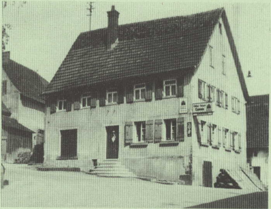
Gasthof zum Lamm

Reachterhand allmächtige Wälder, Lenks dr Bluast ond greane Felder, Gradaus siehst uf Auastei, Beilste, Abstatt, Ilsfeld nei.