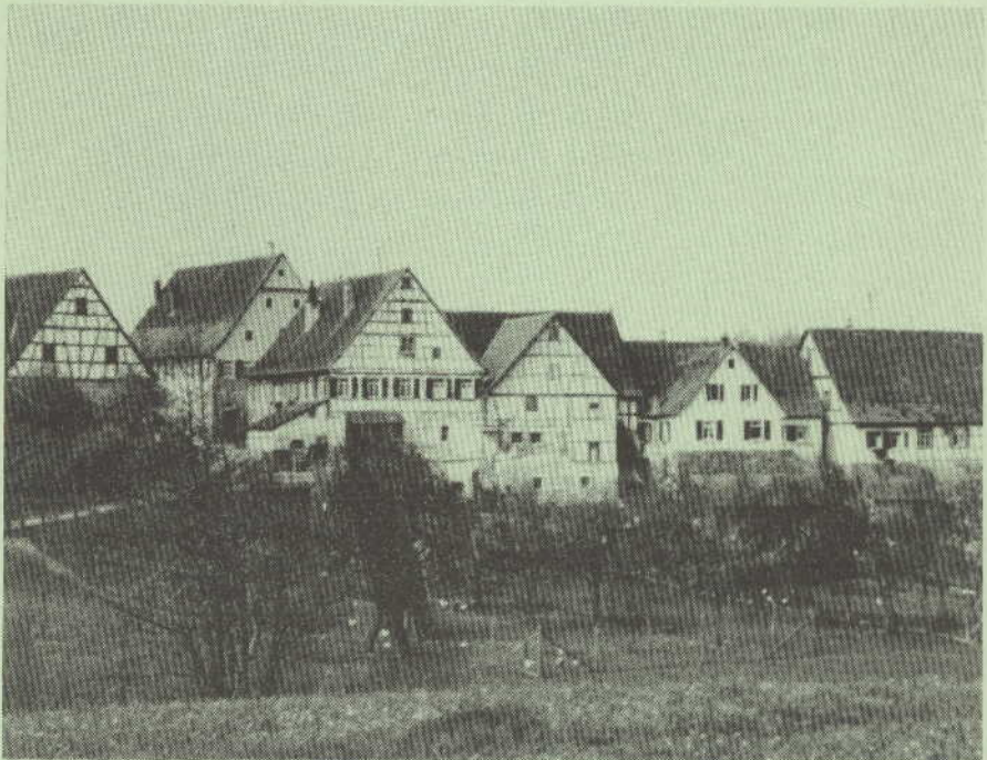
Ansicht vom Steinächle

26 Z' Burschel hemmar d' Bah bestiege, Ond dr Gottlob voll Vergnüage Kramt sei Wanderpäckle aus: Etz was monet'r, kommt raus?